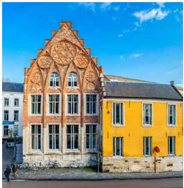
De Faculteit Economie in de Naamsestraat in Leuven

Homecoming website: https://connect.kuleuven.cloud/page/Homecoming