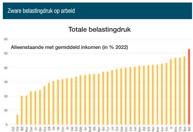
Afbeelding 1

In de Scandinavische landen is dit gemiddeld 58%, in de buurlanden 53%. Die zware belastingdruk op arbeid is schadelijk voor onze economie gezien het werken ontmoedigt. Er is dan ook een terecht brede consensus dat die belastingdruk op arbeid naar beneden moet (ook al is er wel discussie over of dat dan vooral voor de laagste, de gemiddelde of de hogere lonen moet). Het echte probleem ligt evenwel vooral in de financiering.